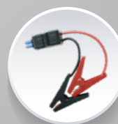
Клеми пускового пристрою

ТРАДИЦІЇ НІМЕЦЬКОЇ ЯКОСТІ ДОСТУПНІ КОЖНОМУ!