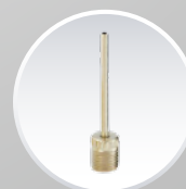
Голка для накачування спортивного інвентарю