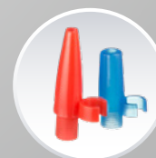
Насадки конусні (2 шт.)

ТРАДИЦІЇ НІМЕЦЬКОЇ ЯКОСТІ ДОСТУПНІ КОЖНОМУ!