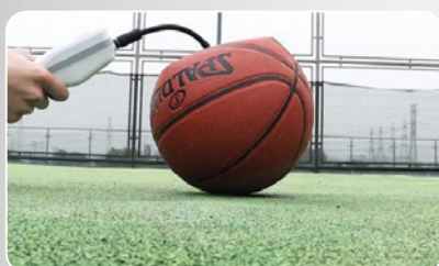
НАКАЧУВАННЯ СПОРТИВНОГО ІНВЕНТАРЮ