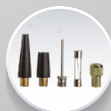
Насадки для накачування