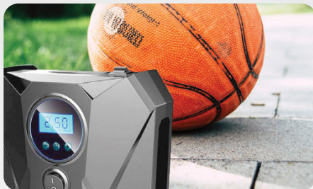
НАКАЧУВАННЯ СПОРТИВНОГО ІНВЕНТАРЮ