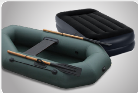
РЕЖИМ ВИСОКОГО ТИСКУ / ВЕЛИКОГО ОБ'ЄМУ