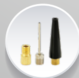
Насадки для накачування