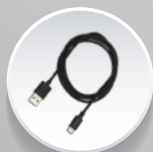
Кабель USB Type-C для зарядки