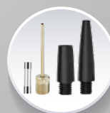
Насадки для накачування

ТРАДИЦІЇ НІМЕЦЬКОЇ ЯКОСТІ ДОСТУПНІ КОЖНОМУ!