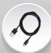
USB-кабель для зарядки