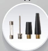
Насадки для накачування